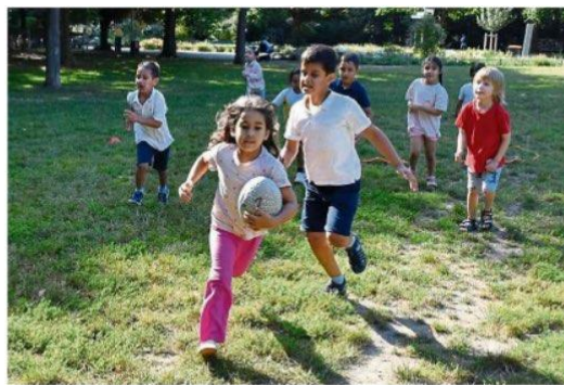
Mit dem Ei unter dem Arm ab durch die Mitte: Die Kita-Kinder lernen auf dem Goetheplatz die wichtigsten Regeln und den Spaß am Rugby-Sport kennen.